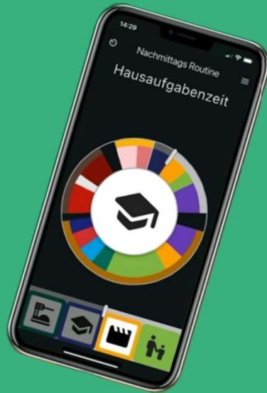
nonu Timer (App)

„Zeit ist das, was man an der Uhr abliest“