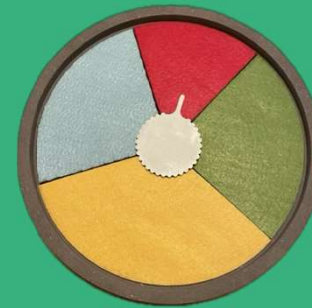
nonu Planer (Hardware)