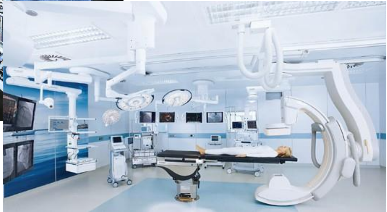
OP Saal heute