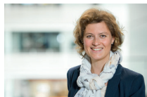
Marena-Nathalie Ostermann Kompetenzzentrum Frau & Beruf Region Aachen – Zweckverband

Sie haben Fragen zum Qualitätssiegel oder weiteren regionalen Unterstützungsangeboten im Bereich Vereinbarkeit von Beruf und Privatleben? Sprechen Sie uns gerne an!